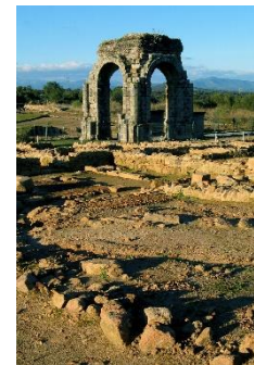
Arco de Cáparra