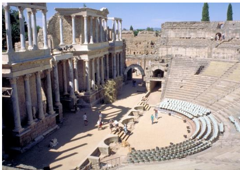
Teatro de Mérida