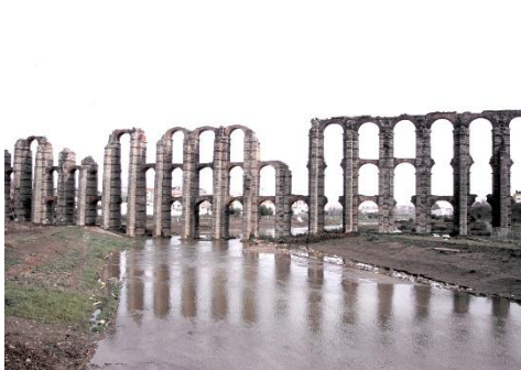
Acueducto de Mérida

Para cruzar los ríos construyeron puentes, como el de Alcántara. Y el campo, los romanos edificaron villas.