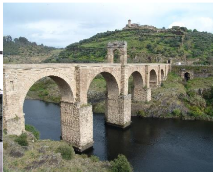
Puente de Alcántara